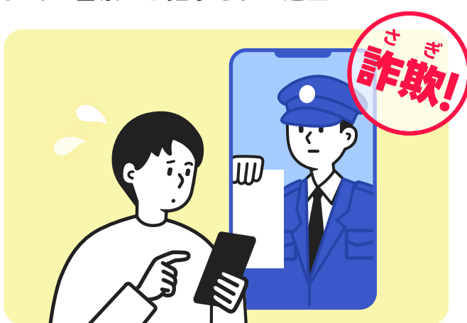
SNSで警察から指示された送金