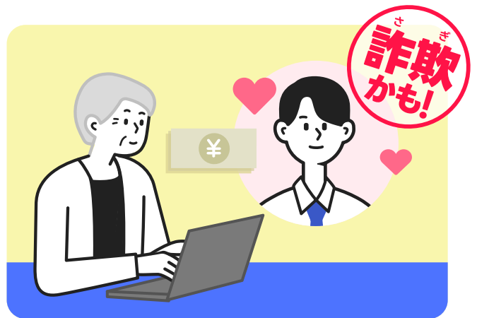
SNSで知り合った相手との共同投資の話