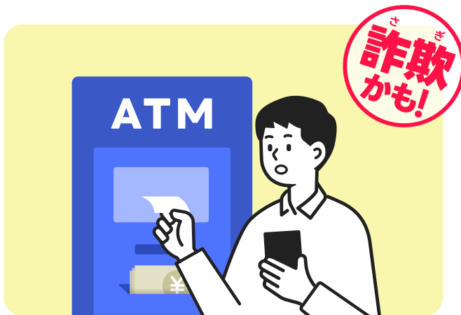
SNSを使った専門家からの儲け話